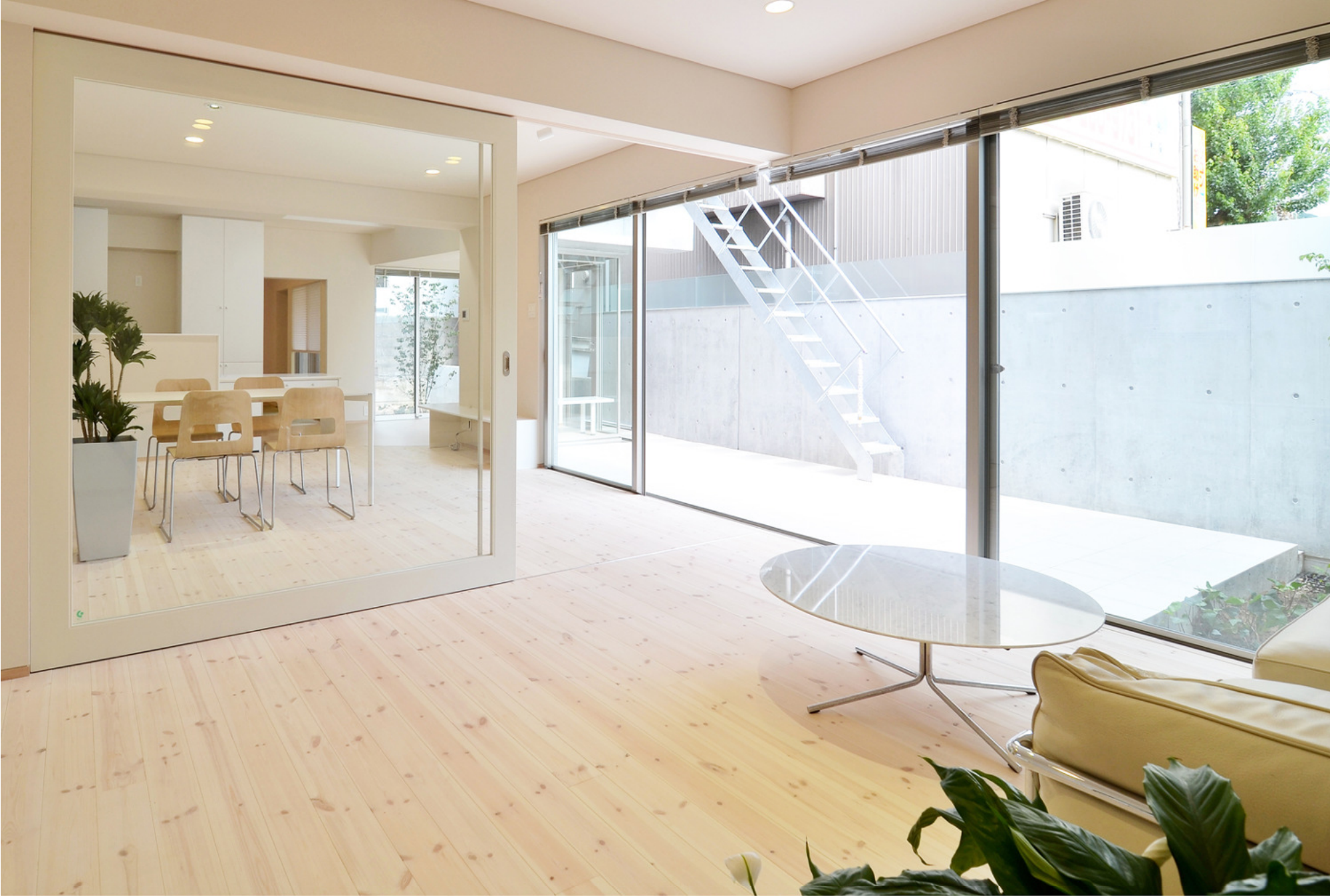
静の居間（写真手前）と動の居間（奥）は大型ガラス戸で仕切れる。静かにくつろぎたい家族と、楽しく遊びたい家族が同じゾーンで並行した時間を過ごせます。