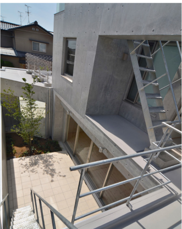
テラスから外部階段を上って屋上へ。