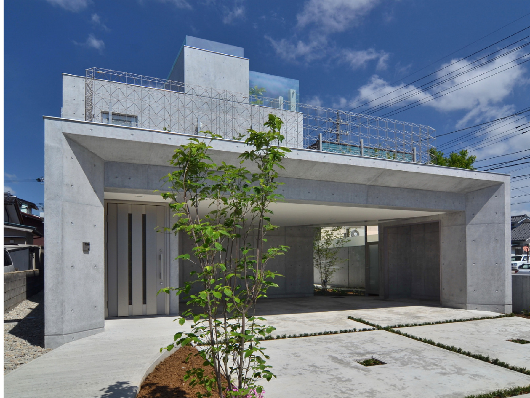
テラスはガラスで仕切り（1階右奥）通りからの拒絶感低減を計りました。車庫の屋上は花や野菜作りが楽しめる構造とし、通風の良いフェンスで囲んでいます。