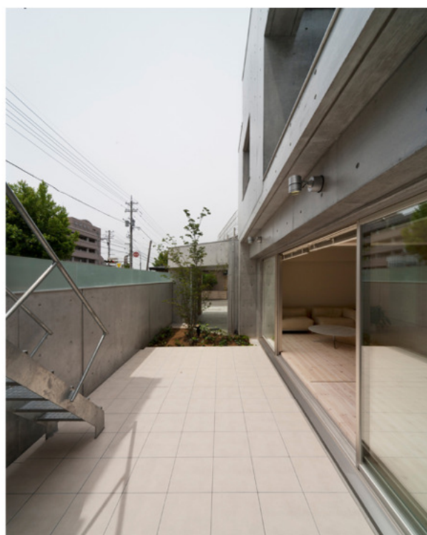
居間と連続したテラスは屋外の居間として楽しめる空間。通りとは気配の見える透明ガラスで仕切り、ご近所の人から訪れることもできます。