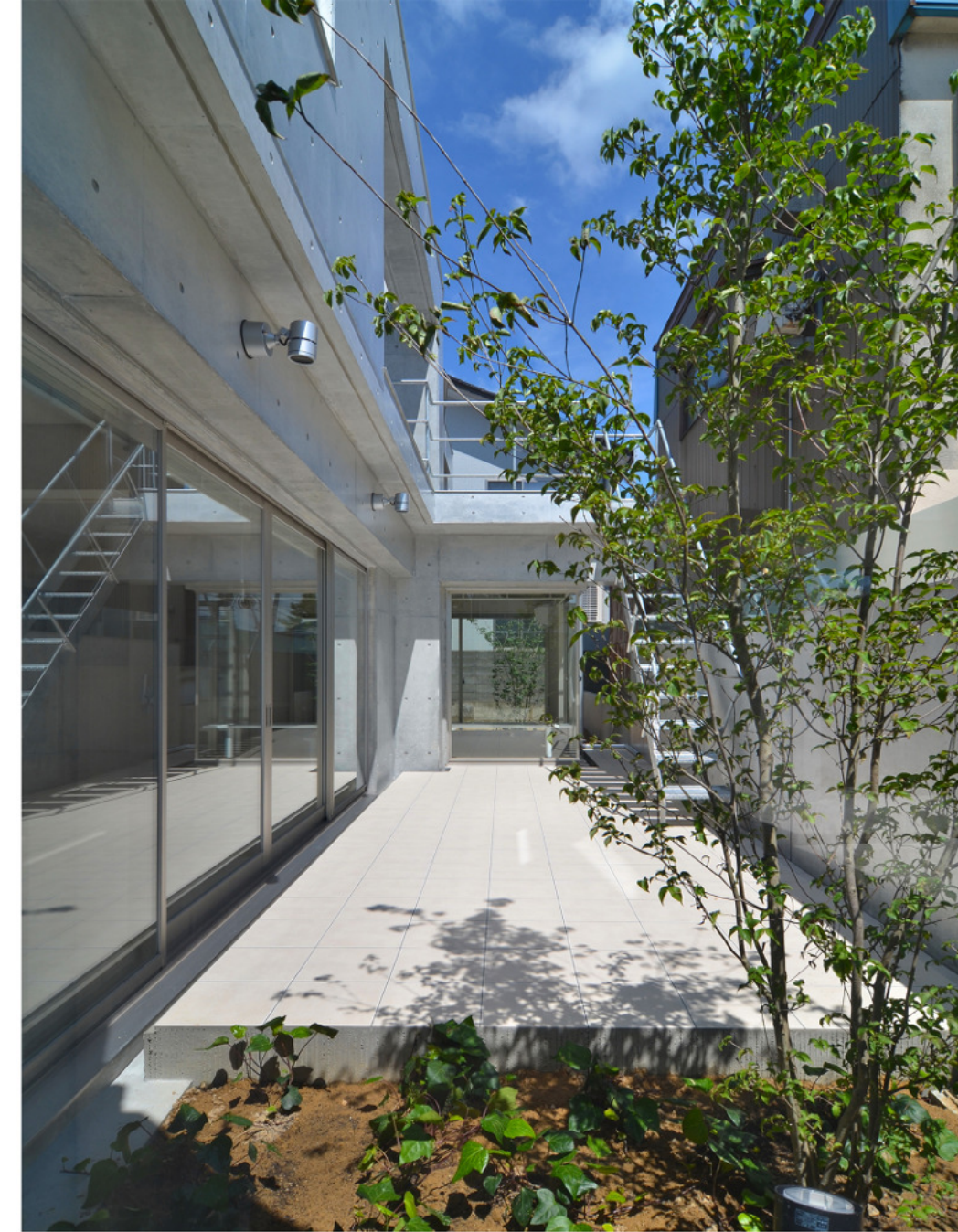
東西に細長い敷地です。陽光を享受すべく南側を3m空けた配置計画としています。そして通りからは透明ガラスで仕切っているので、住んでいる気配が敷地の奥まで窺えます。