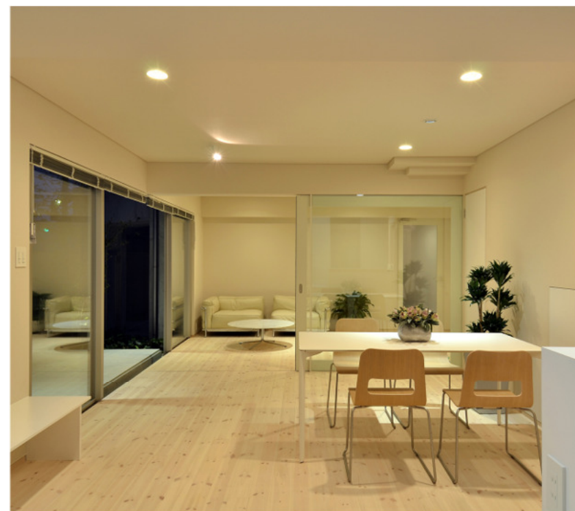
窓際の低いカウンターは、子供が宿題・工作・お絵かき。又、大人もパソコン等に。いつも同じゾーン空間で。