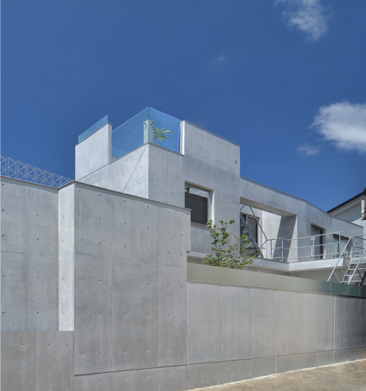
屋上テラスはガラスで防風した落ち着けるテラスです。遠い風景や花火も見える癒しの空間です。