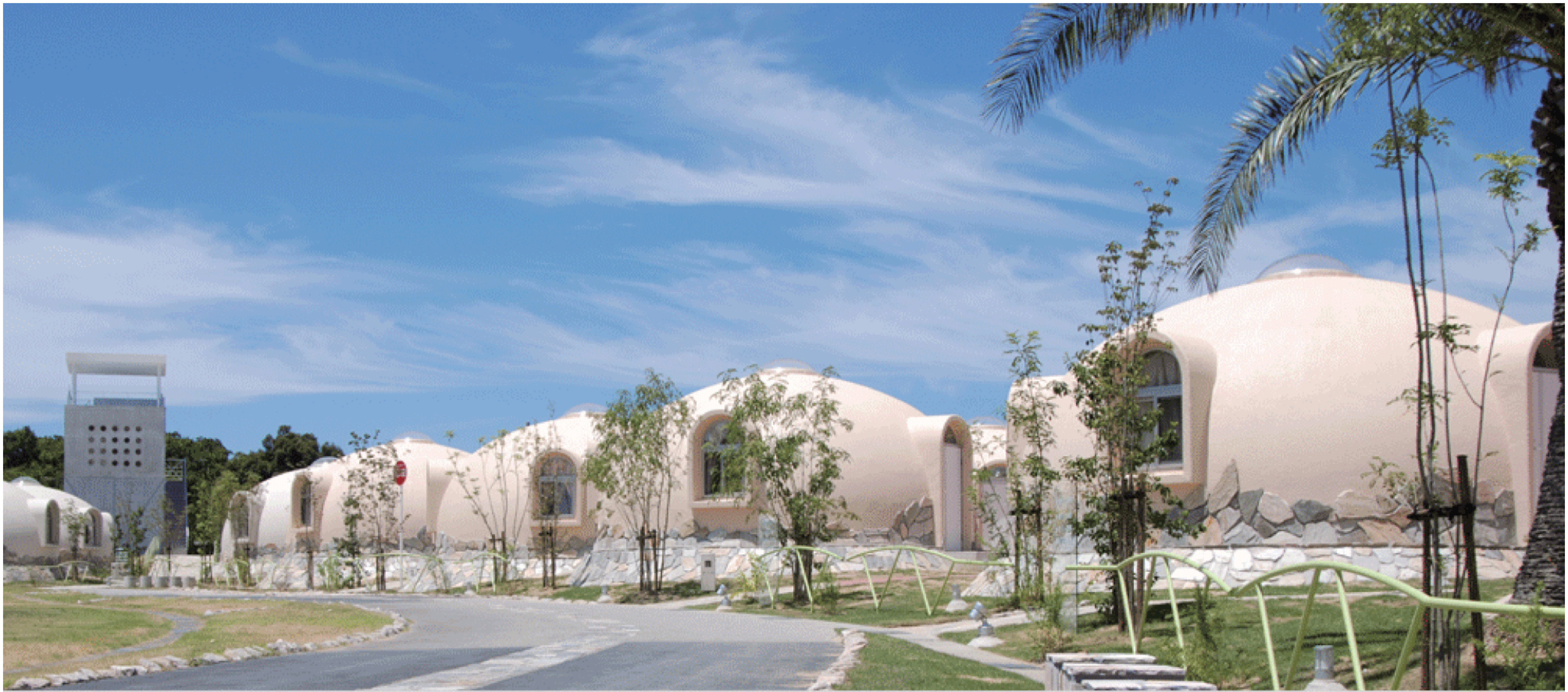
視覚全体をより強く感じていただく目的で丘の頂部に展望台を計画しました。展望台から見渡す視覚は美しい異空間で、幻想的な夜景も楽しめるよう夜は森々とガーデンライトが案内します。