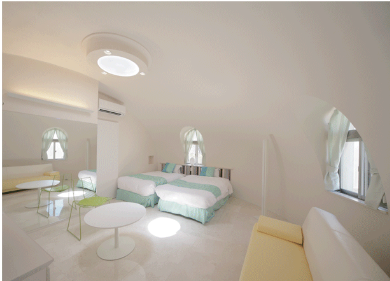
客室は爽やかな空間を意図してデザインしています。 大理石床