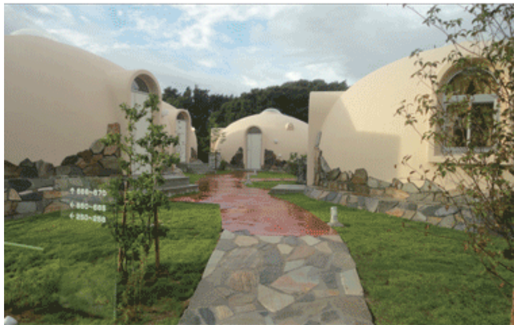
ドームの色と下部石貼り・露地の芝とアプローチ・植木の調和を計りました。