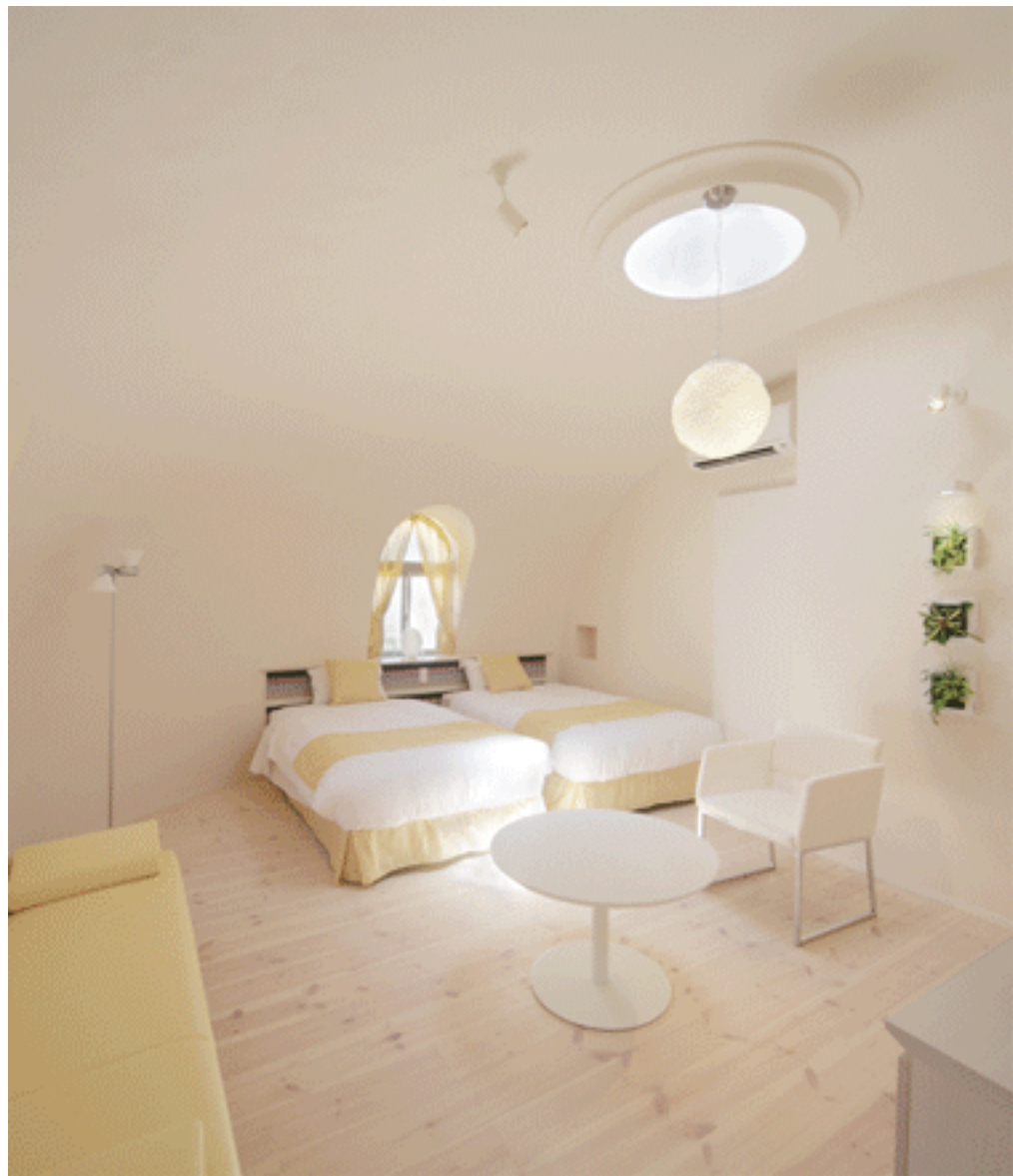
天窓のトップライトからは星空・雲が見えます。 無垢パイン板床