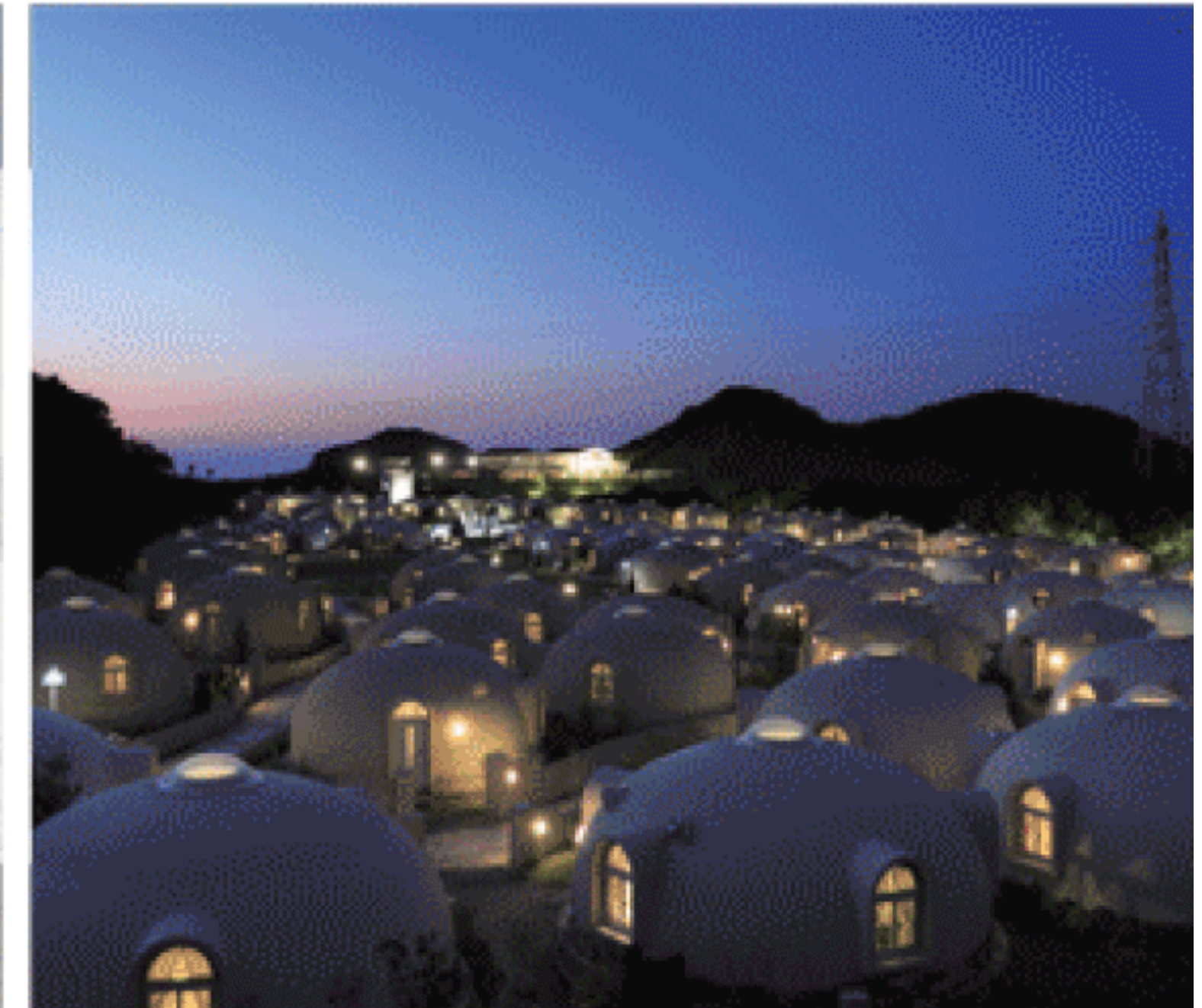
当日の気温が低い日もあめ、全ての照明はトップライトのLEDが換気し部屋の夜景に温かさを演出しています。 夜景（一部1期工事分も含む）